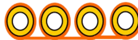
VZHLED 4 x MT